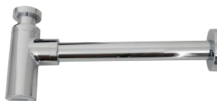
PORCELANOSA. Sifón Hotels Ref. 100101722