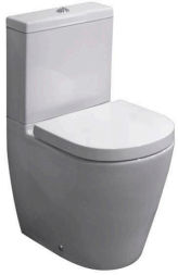
PORCELANOSA. Inodoro Acro Compact Ref. 100160761