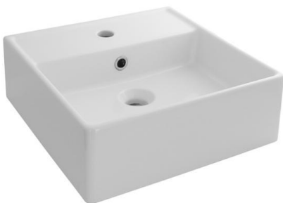
PORCELANOSA. Lavabo Jam 40 cm blanco Ref. 1000090125