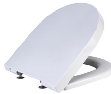
PORCELANOSA. Asiento inodoro Acro Ref. 100123832