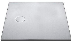
PORCELANOSA. Land Stone+desagüe medidas obra Ref. 100112281