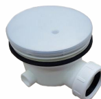
PORCELANOSA. KIP desagüe S/PIP Project Ref. 100060526