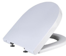
PORCELANOSA. Asiento inodoro Acro Ref. 100123832