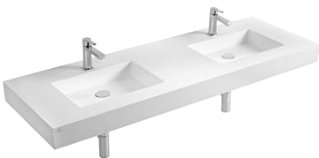
PORCELANOSA. Kole 130*50 BI Ref. 100055785