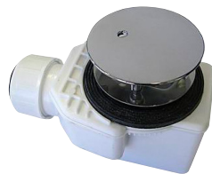
PORCELANOSA. KIT DESAGÜE AUT L-58 Ref. 100060498